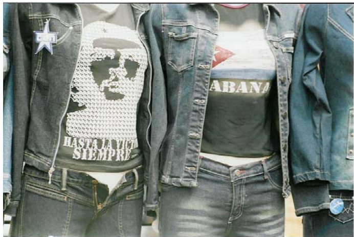
Foto de maniquies en un escaparate de moda joven

Las prendas de Tehuacán tienen como destino final a los consumidores estadounidenses que compran en las tiendas departamentales más grandes de Estados Unidos como Wal-Mart, The Limited, JC Penney, The May Department Stores y Gap 79 . En estas tiendas los pantalones que se producen en Tehuacán y en países centroamericanos o asiáticos llegan a costar hasta mil pesos.